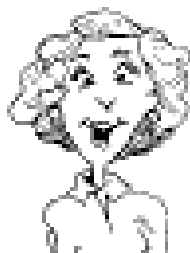
B. AUTEUR2 Organisation 2 Ville 2, Pays 2