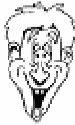
C. AUTEUR3 Organisation 3 Ville 3, Pays 3