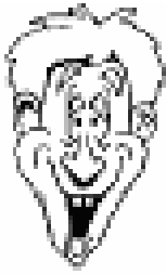
A. AUTEUR1 Organisation 1 Ville 1, Pays 1